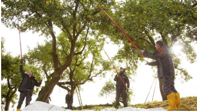
Die Mitarbeiter bei der Ernte (Archivbild): Neben den Streuobstwiesen und privaten Anlieferungen hat das Unternehmen selbst auch gepachtete Flächen mit Obstbaumbeständen.